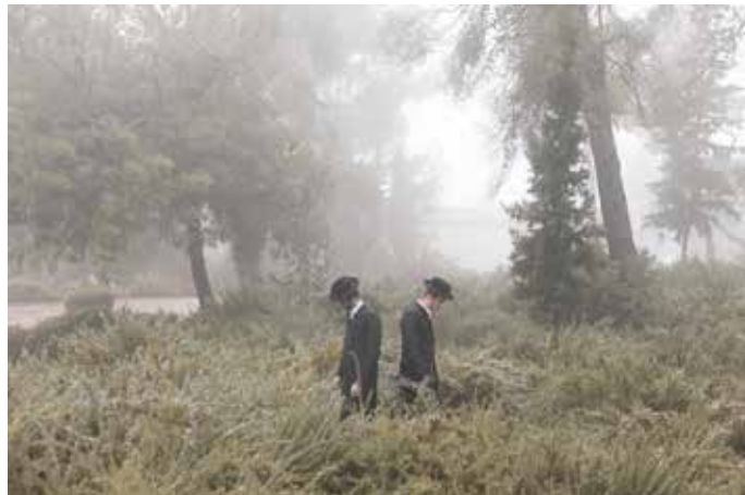
aus der Serie Baruch , 2020

Die Ausstellung #RISK verhandelt große aktuelle gesellschaftspolitische Themen wie Revolutionen, bewaffnete Konflikte, Migration und Klimawandel, beleuchtet aber auch persönliche Betroffenheiten, die dazu führen, dass der Mensch aus seiner Komfortzone heraustritt, Grenzen überschreitet und mit dem Alltag bricht. Dass diese Themen immer wieder Bezüge aufeinander nehmen und eng miteinander verwoben sind, verdeutlichen die sieben ausgewählten fotografischen Positionen.