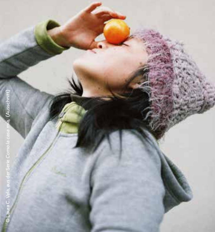
© Laura C. Vela, aus der Serie Como la casa mia, (Ausschnitt)