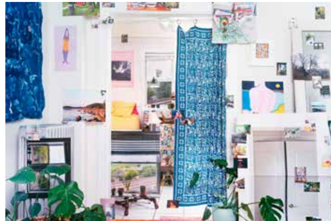
RK-08282018-01142022, 2022 (Ausschnitt), aus der Serie Resident Aliens

Unter dem Titel #EGO treten vier Künstler*innen in einen Dialog, die von der Suche nach sich selbst und der eigenen Position in der Gesellschaft erzählen. Die verschiedenen Arbeiten zeichnen persönliche (Familien-)Geschichten, Erfahrungen der Migration, Zugehörigkeit und Entfremdung nach und verhandeln die damit zusammenhängende Konstruktion von Identität. Die Ausstellung entwirft unterschiedliche Momente der Begegnung im Bild und hinterfragt Wahrnehmungs- und Wirkungsweisen der Fotografie, die eng mit der Produktion von Fremd- und Selbstbildern verknüpft sind.