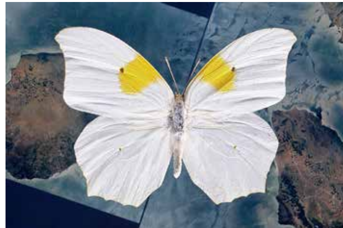
Alex Grein, Anteos Clorinde, Peru , 2021 (Videostill, Detail), 1-Kanal HD-Video, Courtesy: Die Künstlerin und Galerie Gisela Clement, Bonn

Die Ausstellung #NEXT bringt sechs Positionen zusammen, die sich mit drängenden sozioökologischen Fragestellungen und Herausforderungen der Gegenwart und nahen Zukunft auseinandersetzen. Mithilfe künstlerisch-wissenschaftlicher Methoden untersuchen sie unser Verhältnis zur Natur, reflektieren Aspekte des Verschwindens und Bewahrens und schärfen unser Bewusstsein für nachhaltige Lebensformen. Gleichzeitig denken sie über den zukünftigen Umgang mit fotografischen Bildern und neue Materialitäten nach.